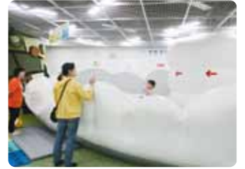
ブルルンとどらいぶ