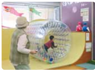
クルクルハムスター